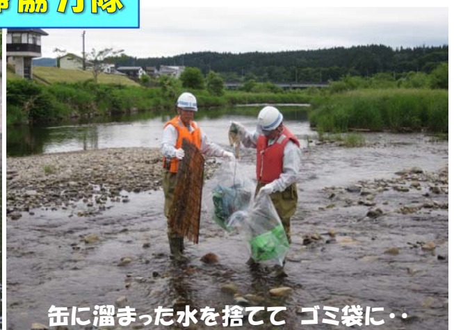
缶に溜まった水を捨てて ゴミ袋に・・