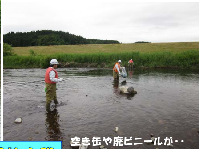
空き缶や廃ビニールが・・