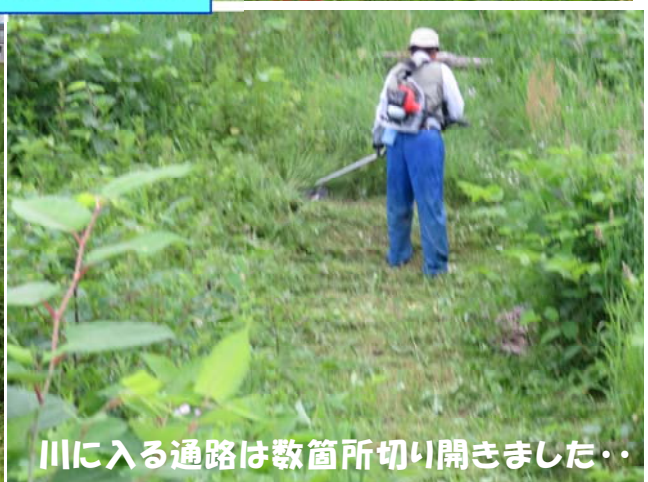
川に入る通路は数箇所切り開きました・・・