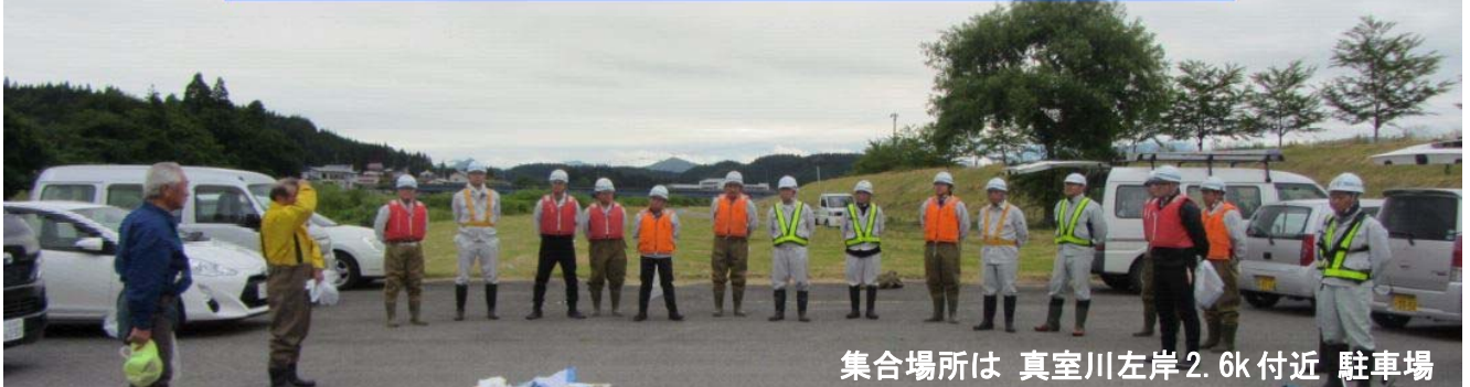
集合場所は 真室川左岸 2.6k 付近 駐車場