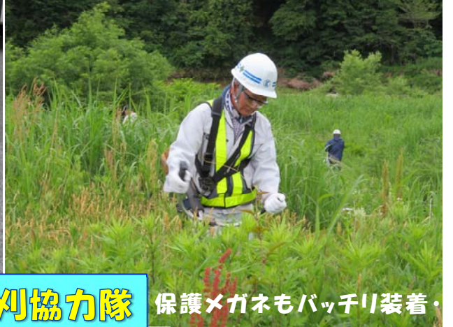
保護メガネもバッチリ装着・・・