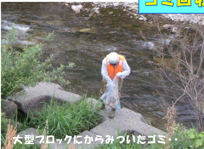
大型ブロックにからみついたゴミ・・