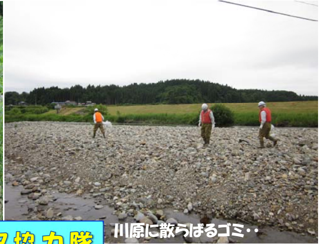
川原に散らばるゴミ・・