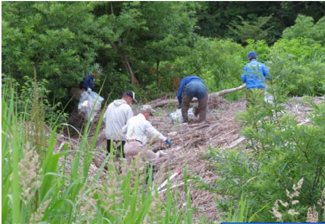
増水時に打ち上げられたゴミ・・