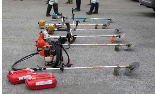
草刈機は6台準備・・・