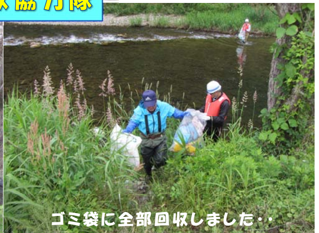
ゴミ袋に全部回収しました・・