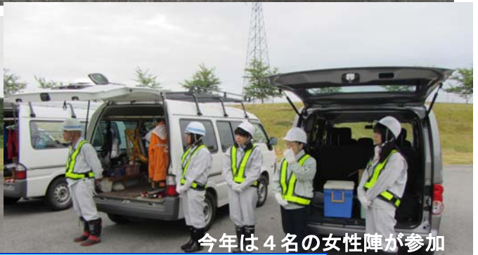
今年は 4 名の女性陣が参加