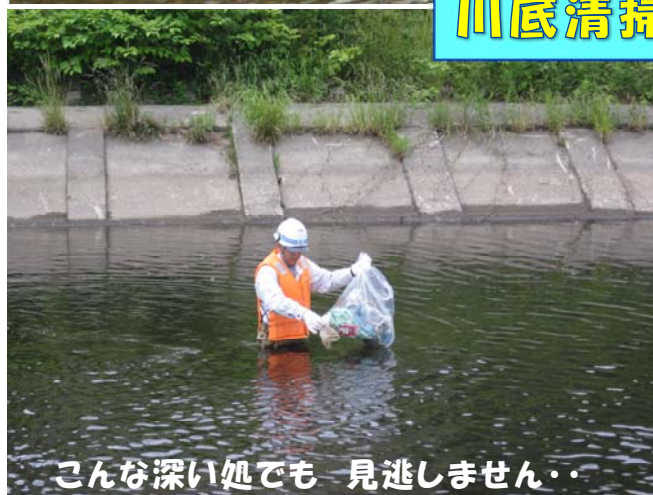
こんな深い処でも 見逃しません・・