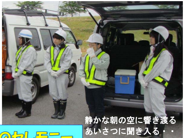
静かな朝の空に響き渡るあいさつに聞き入る・・・