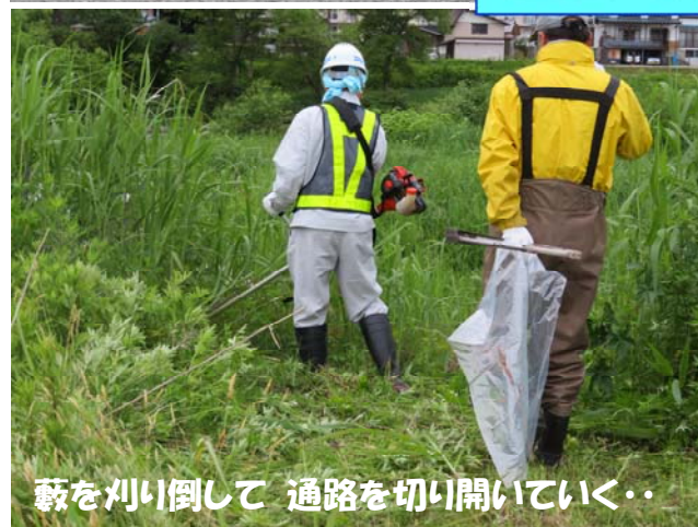
藪を刈り倒して 通路を切り開いていく・・・